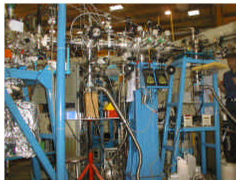
La ligne de lumière synchrotron SU5 du LURE (Orsay) où les échantillons d'acides aminés ont été irradiés induisant une asymétrie significative à l'état solide. On distingue à gauche la cellule d'irradiation et au centre le polarimètre permettant de calibrer la polarisation du rayonnement UV lointain.

La biologie n'est pas symétrique. Nous pouvons être droitier ou gaucher, de même certains de nos organes occupent une position clairement asymétrique : le cœur du côté gauche et le foie du côté droit. Cette rupture de symétrie existe-t-elle au niveau moléculaire ? Oui ! Des bio-molécules comme les acides aminés – ces petites molécules qu'utilisent nos cellules pour fabriquer des protéines - ou les sucres de l'ADN, sont des molécules chirales (du grec chiro , les mains) qui existent a priori sous deux formes – appelées énantiomères -, de même formule chimique mais non-superposables (comme nos mains) : l'énantiomère gauche et l'énantiomère droit. Pourtant ces molécules, telles qu'on les rencontrent dans les organismes vivants, présentent une asymétrie fondamentale : les acides aminés sont tous du type gauche alors que les sucres de l'ADN sont du type droit, c'est ce que l'on appelle l'homochiralité de la vie. De même les molécules que l'on rencontre dans les agents de saveurs et les parfums possèdent des odeurs différentes selon qu'elles sont du type gauche ou droit. Plus généralement, en sciences naturelles, cette propriété remarquable, mise en évidence par Pasteur en 1847, est appelée asymétrie bio-moléculaire.